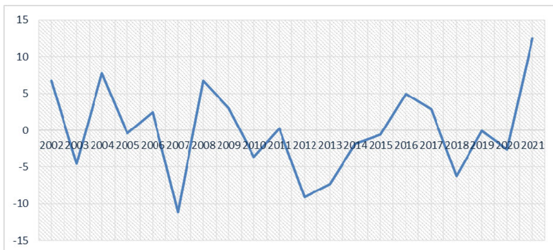
Рис. 3. Відхилення від тренду врожайності озимої пшениці в Миколаївській області за період 2002–2021 рр.

торії Миколаївської області ця культура має найстійкіші врожаї.