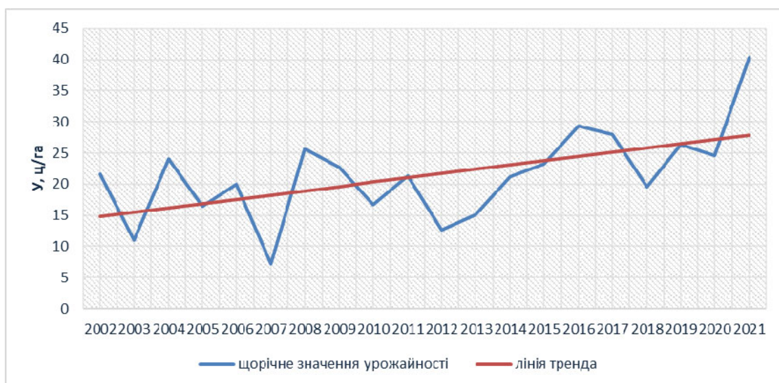
Рис. 2. Динаміка врожайності озимої пшениці в Миколаївській області за період 2002–2021 рр.

за методом гармонійних зважувань урожай за період має тенденцію до підвищення.