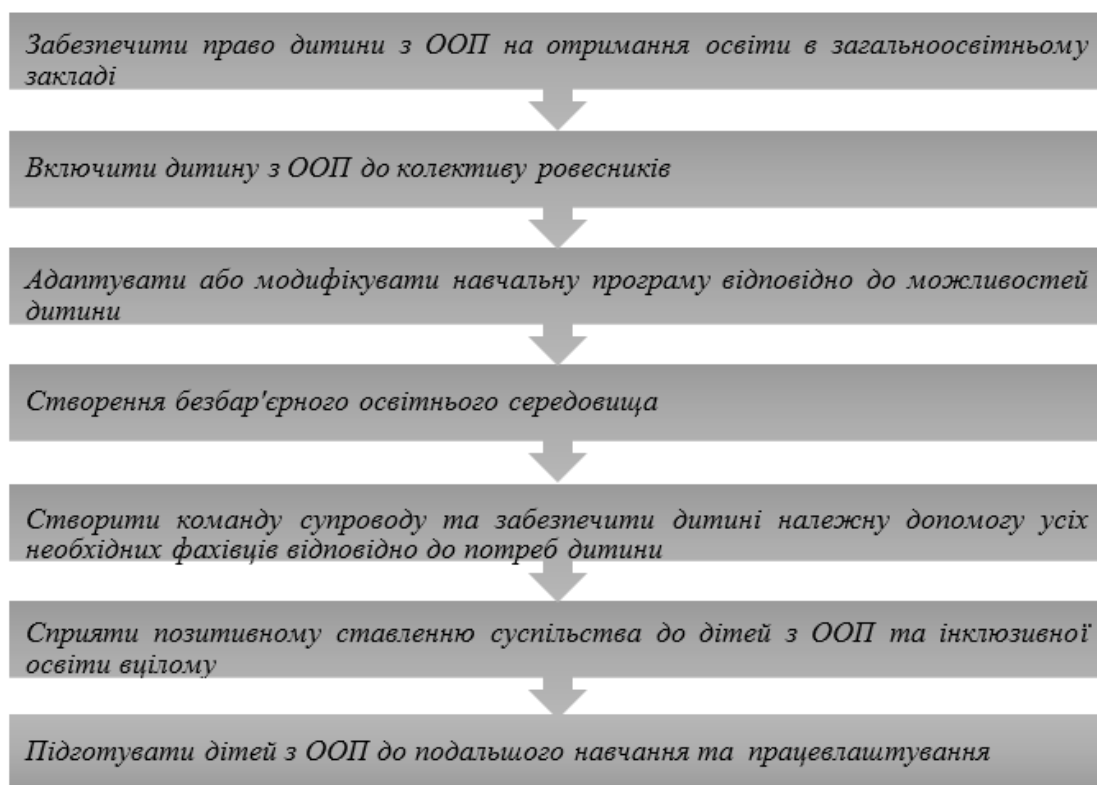
Рис. 1. Завдання інклюзивної освіти в загальноосвітньому закладі

з перерахованих вище завдань є напроцуд важливим. Однак особливо вагомим є залучення дитини до колективу [1; 3]. Кожен освітній заклад, кожен колектив має власні правила, цінності та норми поведінки. Варто нагадати, що колектив дозволяє отримати соціальний досвід взаємодії з іншими. Саме тому цінність цього завдання полягає у його значущості для усіх учасників колективу та освітнього процесу в цілому, а саме: