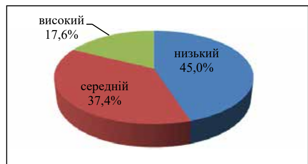
Рис. 1. Рівні прояву резильєнтності особистості, %

Отримані показники свідчать про наявність значної кількості осіб із низькою резильєнтністю – майже кожен другий не здатний амортизувати наслідки впливу факторів стресової ситуації. Можливо, така картина виявилася тому, що наше дослідження проводиться в умовах, коли для всіх учасників продовжується життєдіяльність у стресових умовах, вони є тривалими і коли зміняться невідомо (війна триває і чинники стресу актуальні 24/7). Тобто ресурси суб'єкт витрачає не на відновлення, а на виживання в умовах поточного життя, оскільки не здатна амортизувати наслідки впливу тривалої стресової ситуації. У реальному житті це проявляється у тому, що вони не можуть швидко повернутися до того рівня психічного і соціального функціонування, який мали до моменту настання стресової ситуації. Застосування статистичного аналізу на основі ф-критерію